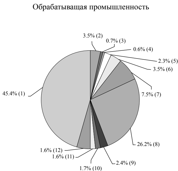
График 1. Структура обрабатывающей промышленности Армении в 2006 г.

В структуре обрабатывающей промышленности, как и в предыдущие годы, основная доля пришлась на производство пищевых продуктов, включая напитки (45.4%) и металлургическую промышленность (26.2%). Затем следовали: производство прочих неметаллических минеральных продуктов – 7.5%, химическая промышленность – 3.5%, производство табачных изделий – 3.5%, производство готовых металлических изделий – 2.4%, издательская и полиграфическая деятельность, тиражирование записанных носителей информации – 2.3%, производство машин и оборудования – 1.7%, производство ювелирных изделий – 1.6%, производство текстильных изделий – 0.7%, производство одежды, выделка и крашение меха – 0.6%, другие виды деятельности – 4.6% (см. График 1 ).